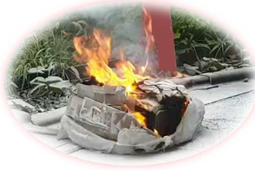
ごみ袋からバッテリーが！？