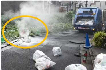
可燃ごみ回収中に、ごみ袋から煙！！

住宅の中だけではなく、誤った廃棄方法によるごみ処理中の火災も急増しています。不要品を処分する際は製品の取扱い説明書をよく確認した上で、お住まいの自治体の廃棄方法に従い廃棄してください。